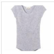
Marie Sixtine, 89€

Ma nouvelle obsession: le body en laine. Doux et sexy, cocoon et féminin, il combine tous les critères pour qu'on se sente bien.