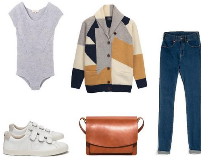
Gilet patchwork Aigle, (130€), baskets Veja, 109€, sac en cuir &Other Stories (145€), pantalon en denim, Dr Denim, 50€.

Le jour, on enfile un jean, un gros gilet et une paire de baskets. Le soir, une jupe longue et une paire d'escarpins à talons. J'adore l'ambivalence de cette pièce caméléon.