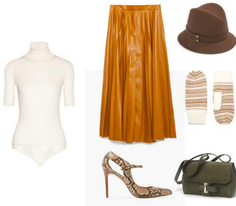
Jupe Zara (49,95€), chapeau Nathan Baume (79€), moufles Wesc (35€), escarpin effet python Mango (45,99€), sac Simplissime de Delvaux, prix sur demande.

Le jour, on enfile un jean, un gros gilet et une paire de baskets. Le soir, une jupe longue et une paire d'escarpins à talons. J'adore l'ambivalence de cette pièce caméléon.